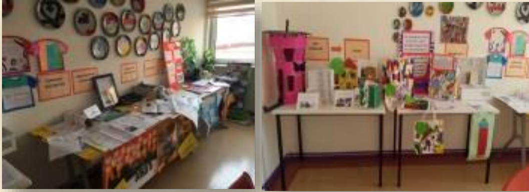
Görseller. MYP Danışmanımız için hazırladığımız sergimizden