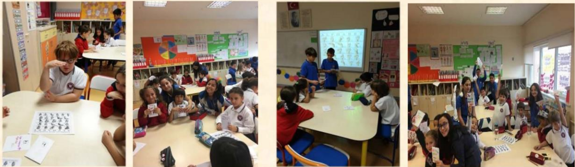
Service learning: Teaching grade 2 PYP students the sign language basics

To round up our unit of inquiry, we interviewed members of the school community about communication, to later interpret the results, write a report and give presentations to share our findings with others.