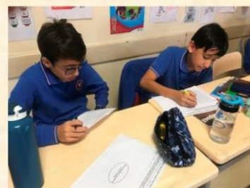
Interviewing others about the factors that affected us & spidergram work

Later on, we had a discussion about the effects of birth order on our identities and shared our real life experiences.