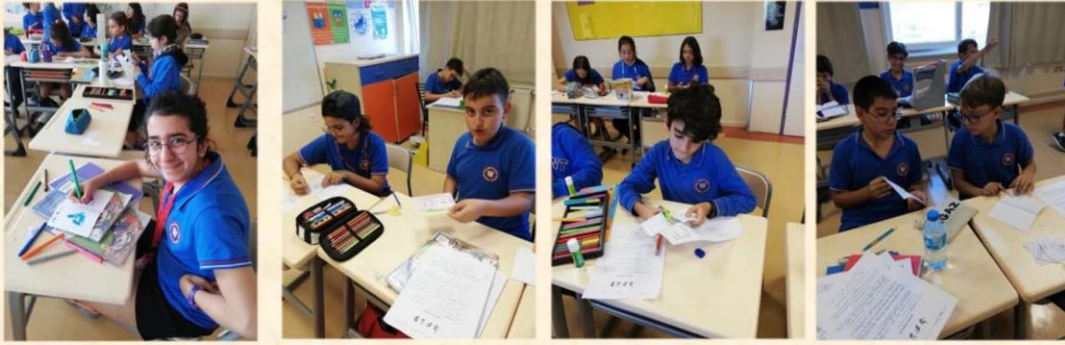
Working on sign language info- brochures