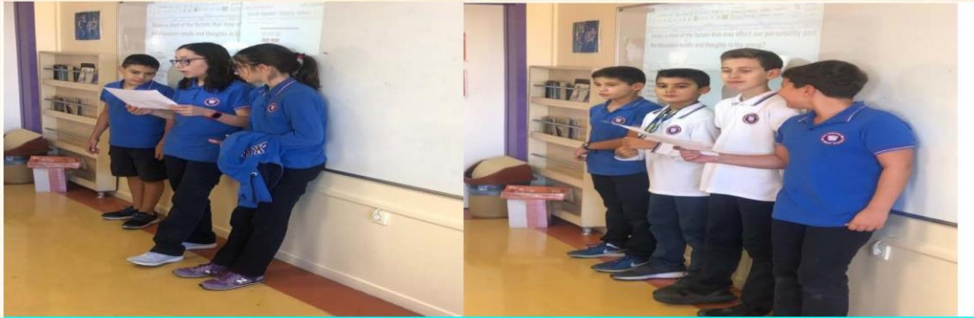
Creating a chart and presenting after having a group discussion about the factors that may affect ones personality and their affects.

As an introduction to the MYP unit of inquiry, we asked the question 'Who am I?' to ourselves. We watched a video about a teenage scientist Jack Andraka and his contribution to cancer research. Jack Andraka set a good example for all of us with his determination to succeed. We found out about the factors affecting our identities and what kind of personality traits teenagers have. After describing our own personalities and those of our classmates, we shared our thoughts with our classmates and checked if we were right about them and discovered that our judgments about people's identity can sometimes be very wrong.