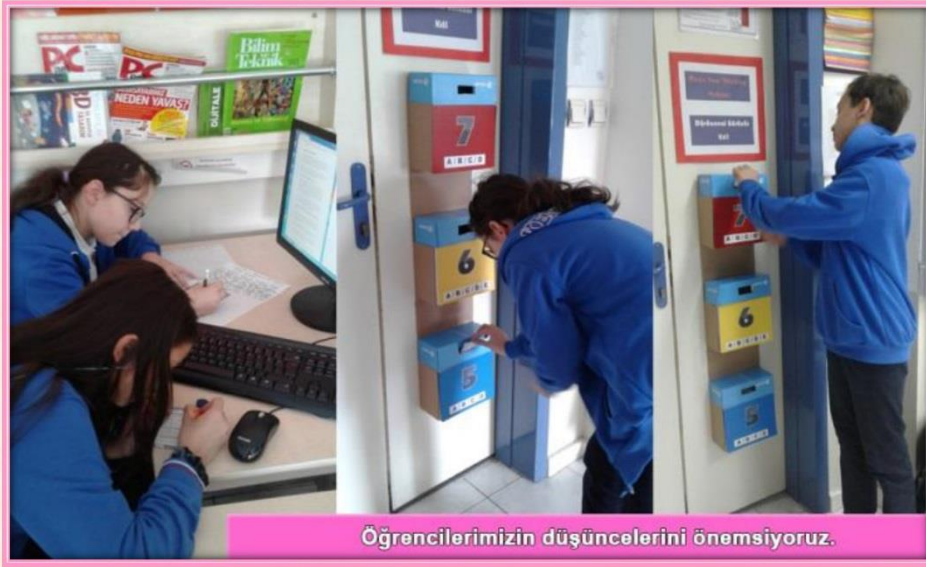
Öğrencilerimizin düşüncelerini önemsiyoruz.

Tasarım dersinde öğrencilerimizin öğrendiklerini düşündükleri üç şeyi, geliştirdikleri iki becerilerini ve geliştirmek istedikleri bir yönleri belirlemek amacıyla onların düşüncelerini görünür kıldık. Öğrencilerimiz kendilerine verilen düşünce formlarını doldurdular ve onlar için hazırladığımız düşünce kutularımıza attılar. Bu çalışma sayesinde biz öğretmenler olarak öğrencilerimizin değerli katkıları ile dersimiz hakkında dönüşümlü düşünme fırsatı bulacağız.