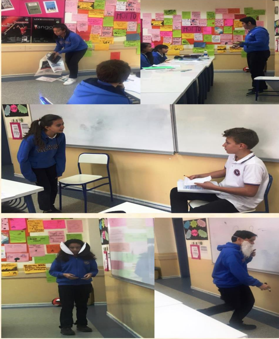
Öğrencilerimizin İletişim Konulu Skeçlerinden Kareler