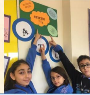
“Doğa ve İnsan” Ünitesini Tanyalım

Dil ve Edebiyat dersinin ikinci ünitesi olan “Doğa ve İnsan”a başlamadan önce kütüphaneye giden öğrencilerimiz; üniteye okuma süreçlerini yapılandıracakları “Serçekuş” kitabının yazarı ile anahtar kavramımız olan “estetik” üzerine araştırma yaptılar.