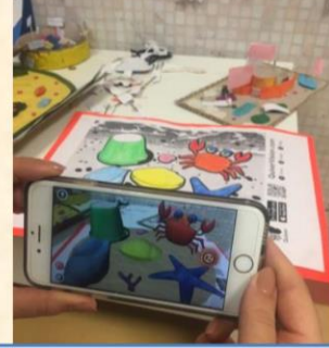
Sonuç Değerlendirme Çalışması

Sonuç değerlendirme çalışmalarında araştıran- sorgulayan ve eleştiren okuyucu profillerini geliştirmekte oldukça fayda sağlayan “Eser İnceleme Formu”nu bu kez de kendi hikayeleri için doldurdular.